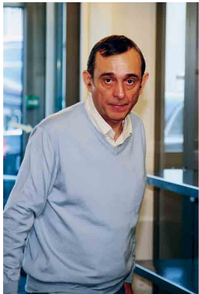
Claude Dauphin, le fondateur de Trafigura.

Contacté, Trafigura n'a pas souhaité répondre aux questions de la Déclaration de Berne.