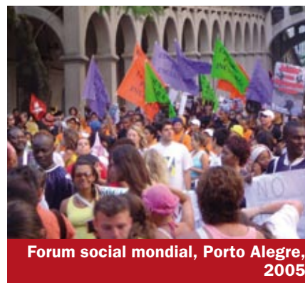
Forum social mondial, Porto Alegre, 2005

* Disponible auprès de la plate-forme Dette & Développement