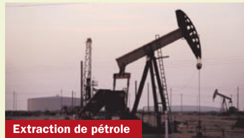
Extraction de pétrole

notamment auprès des pays de l'OCDE. Alors que le PNB par habitant observait une chute dramatique, les dépenses militaires s'envolaient, atteignant, en 1986, 711 % du total des dépenses sociales. En 1988, au lendemain de la guerre contre l'Iran, le pays est au bord de la banqueroute, les infrastructures sont détruites et les cours pétroliers se sont effondrés. L'endettement est gigantesque - il est estimé à 80 milliards $ en 1988 - et les créanciers ferment les vannes. Devant cette impasse pétro-financière, l'agression du Koweït voisin est perçue par Saddam comme une opportunité stratégique ; avec le blocus qui s'en est suivi, elle achèvera en fait de plonger le pays dans la violence et la misère. Le despote, pour sa part, aurait placé en Suisse environ 6 milliards $. Pendant les années 1980, Paris a été l'un de ses plus constants pourvoyeurs d'armes. En réalité, la politique étrangère de la France a été complètement dévoyée par le lobby militaro-industriel (Dassault, Matra, Aérospatiale, Thomson...), sans aucun risque pour ce dernier, puisque les contrats étaient garantis par la Coface (donc par l'Etat). En huit ans de guerre, l'Irak a représenté pour ces entreprises un marché de 6 à 9 milliards d'euros.