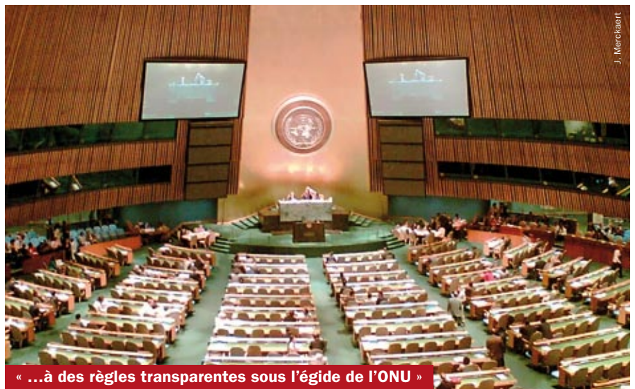
« ...à des règles transparentes sous l'égide de l'ONU »

Répondant à une revendication de longue date des organisations des sociétés civiles du Sud et du Nord, l'ONU a réuni pour la première fois, pour dialoguer sur la dette, l'ensemble des acteurs concernés (créanciers, débiteurs, secteur privé, experts, société civile, organisations internationales). A l'issue de 3 rencontres (New York, Harare et Genève), de mars à juin 2005, la discussion a conclu sur la nécessité d'examiner un « code de conduite pour les débiteurs souverains et leurs créanciers », « l'opérationnalisation de la doctrine de la dette odieuse », des « dispositifs d'arbitrage et de médiation pour faciliter le règlement de différends ». Il a en outre mis en évidence la nécessaire amélioration de la transparence entre créanciers et débiteurs. Ce dialogue devrait se poursuivre en préparation de la conférence des Nations unies sur le financement du développement, à Doha en 2008. Un premier pas vers la démocratisation du traitement international de la dette ?