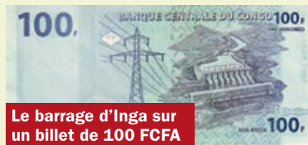
Le barrage d'Inga sur un billet de 100 FCFA

Fin 2004, le stock total de la dette publique externe de la République démocratique du Congo (RDC) s'élevait à 10,8 milliards $, soit 180 % du PNB. 60 % de ces créances sont bilatérales (USA, France, Belgique notamment).