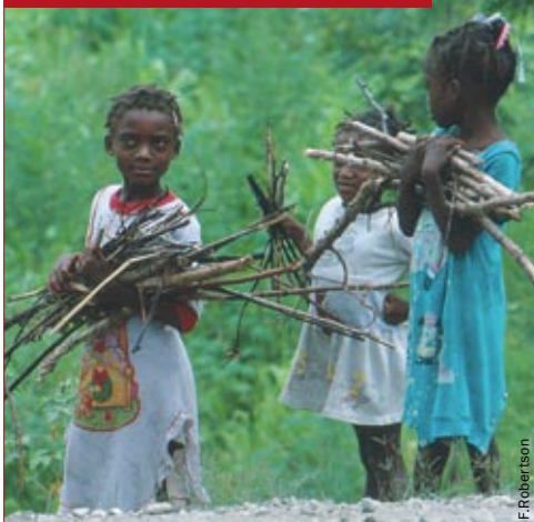
En Haïti, enfants portant du bois

Paul Wolfowitz, Président de la Banque mondiale, avril 2006.