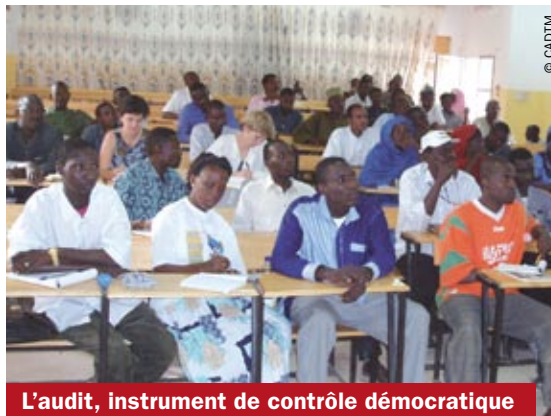
L'audit, instrument de contrôle démocratique

Ces processus devraient ainsi contraindre les gouvernements à rendre davantage de comptes à leurs parlements et à leurs citoyens et à être plus regardants dans la conduite de leur politique de prêt ou d'emprunt.