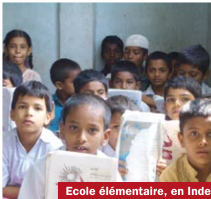
Ecole élémentaire, en Inde