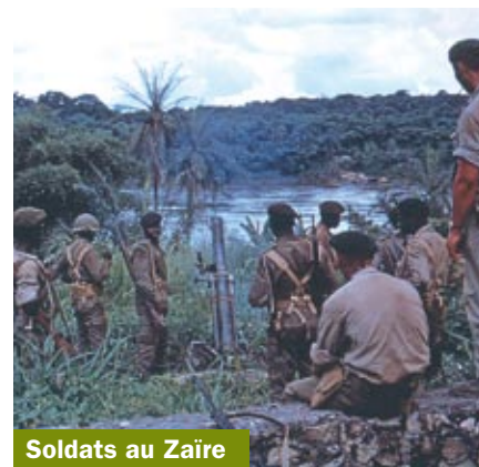
Soldats au Zaïre