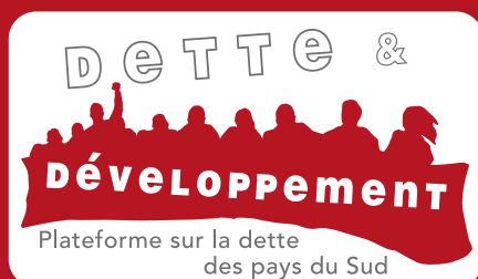
Plate-forme Dette & Développement