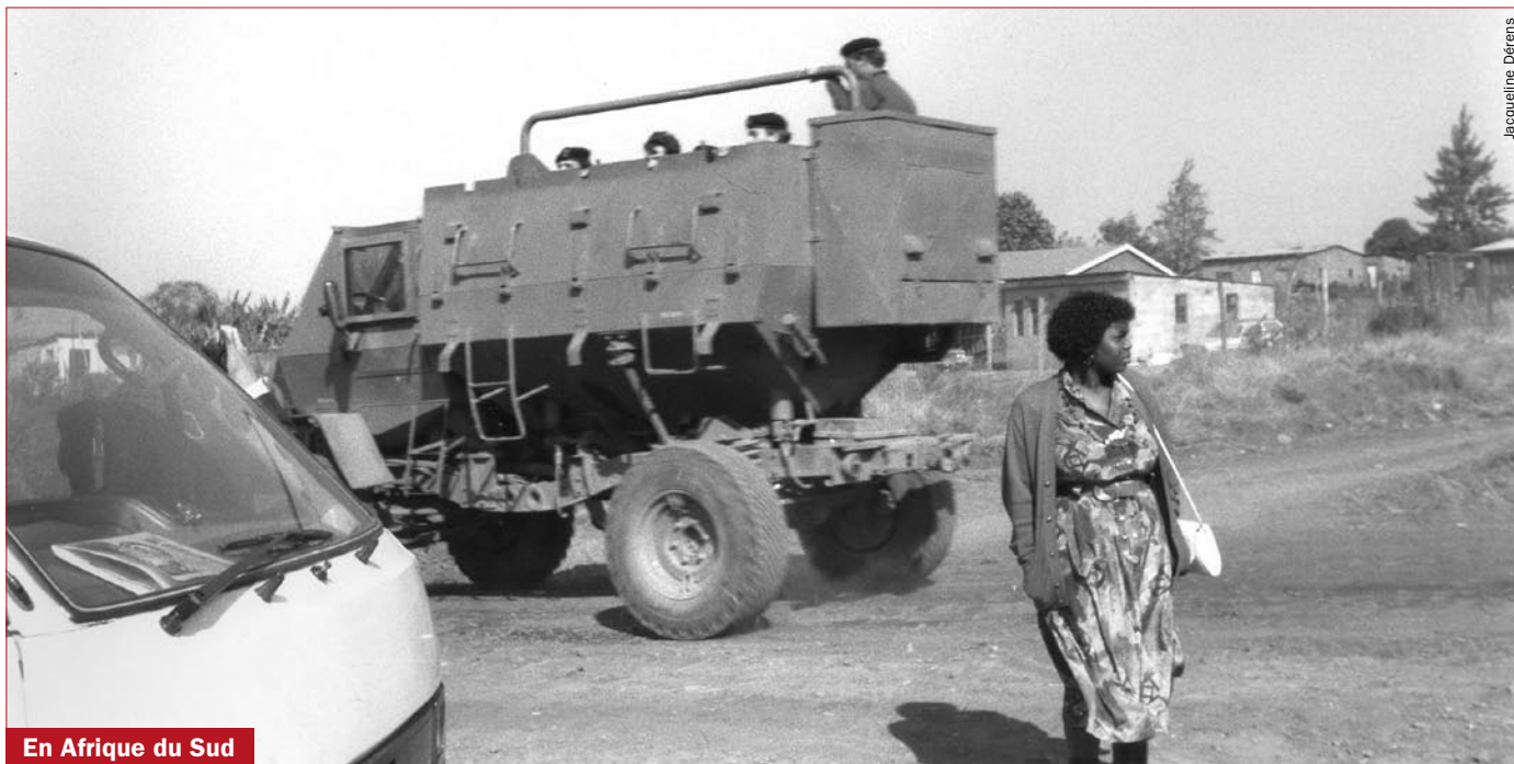
En Afrique du Sud